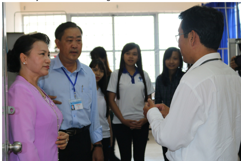
Chủ tịch Quốc hội Nguyễn Thị Kim Ngân tham quan Ký túc xá Trường.

Sau buổi làm việc, Chủ tịch Quốc hội Nguyễn Thị Kim Ngân đã trồng cây lưu niệm trước Hội trường Lớn, nơi diễn ra Hội nghị và tham quan Ký túc xá của Trường.