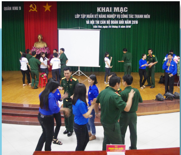
Rộn ràng các điệu múa Khmer quen thuộc.

Trong ngày tổng kết Lớp Tập huấn, chúng tôi tiễn các anh lên xe trở về đơn vị mà trong lòng ai nấy cũng mang một nỗi niềm lưu luyến. Chúng tôi thiết nghĩ những kĩ năng học được qua lớp tập huấn sẽ giúp chúng tôi bản lĩnh và thành công hơn trong công tác Đoàn, tuy nhiên, những tình cảm, sự thấu hiểu giữa quân và dân sẽ là động lực để chúng tôi hoàn thành tốt hơn nhiệm vụ học tập, giảng dạy tại Trường ĐHCT và các anh sẽ vững tin hơn, mạnh mẽ hơn để hoàn thành tốt nhiệm vụ giữ gìn sự bình yên cho Tổ quốc. Hy vọng rằng sẽ có nhiều chương trình giao lưu hơn nữa giữa cán bộ, sinh viên Trường ĐHCT với các đơn vị lực lượng vũ trang Quân khu 9 và các quận, huyện Đoàn.