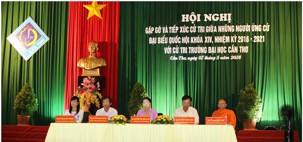
Hội nghị được diễn ra tại Hội trường Lớn, Trường ĐHTC.

Ngày 07/5/2016, Ban Thường trực Ủy ban Mặt trận Tổ quốc Việt Nam (UBMTTQVN) thành phố Cần Thơ phối hợp cùng Trường Đại học Cần Thơ (ĐHCT) tổ chức Hội nghị Gặp gỡ và Tiếp xúc cử tri giữa những người ứng cử đại biểu Quốc hội khóa XIV, nhiệm kỳ 2016-2021 với cử tri Trường Đại học Cần Thơ để trình bày chương trình hành động và vận động bầu cử.