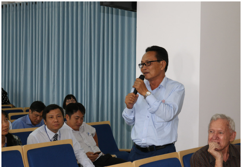
Các đại biểu đóng góp ý kiến tại Hội nghị.

chúc mừng những thành công của Trường ĐHCT trong thực hiện Đề án “Đào tạo theo chương trình tiên tiến tại một số trường đại học Việt Nam giai đoạn 2008-2015” được Thủ tướng phê duyệt ngày 15/10/2008. Đồng thời, đề xuất tăng cường nghiên cứu khoa học trong các CTTT, bồi dưỡng cán bộ quản lý, tăng cường nối kết với các đối tác, doanh nghiệp tạo điều kiện duy trì, phát triển và lan tỏa các CTTT, thu hút sinh viên quốc tế đến học tập tại Trường.