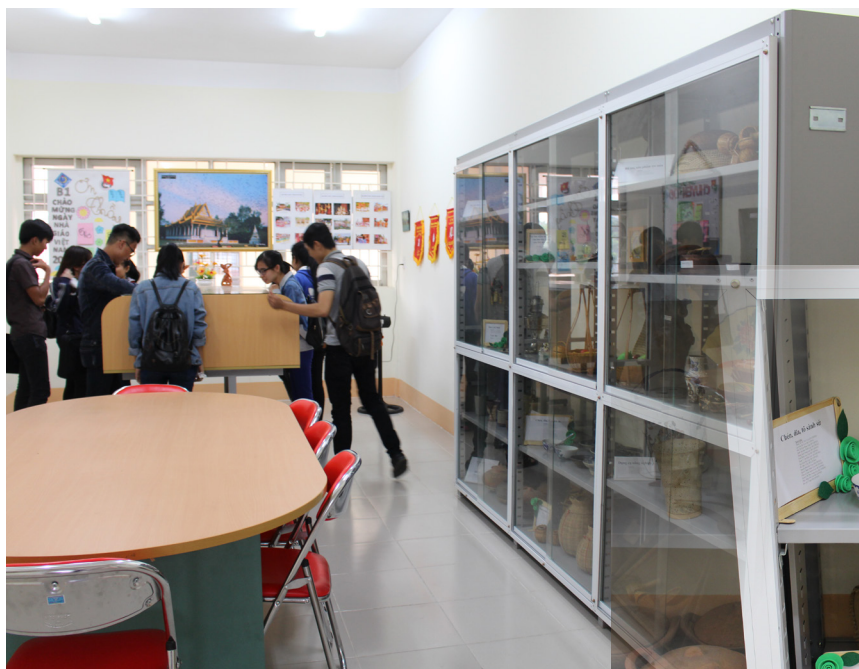
Phòng trưng bày văn hóa truyền thống các dân tộc - Công trình của Khoa Dự bị Dân tộc đạt giải Nhất.