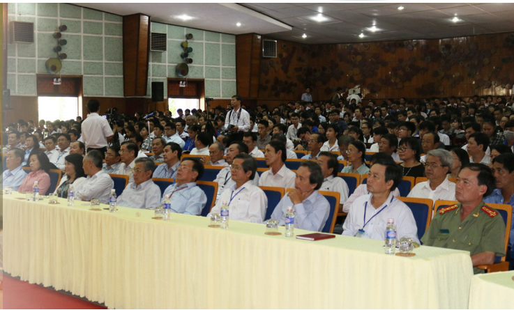
Chủ tịch Quốc hội Nguyễn Thị Kim Ngân trình bày chương trình hành động trước cử tri của Trường ĐHCT.

thể hiện sự tín nhiệm đối với các ứng cử viên đại biểu Quốc hội khóa XIV, những người sẽ truyền tải những tâm tư, nguyện vọng của họ lên Quốc hội.