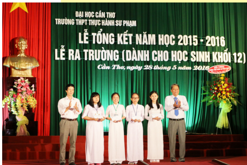
Những gương mặt học sinh giỏi nhất khối 10, 11, 12 nhận thưởng.

Năm học 2014-2015 khép lại trong niềm hân hoan của toàn thể thầy cô và học sinh Nhà trường và hứa hẹn đạt được nhiều thành tích cao hơn nữa trong năm học mới. Đây cũng là dịp để các em học sinh khối 12 bày tỏ tình cảm kính yêu và lòng tri ân của mình dành cho quý thầy cô giáo - những người đã ân cần chỉ dạy để các em vững bước trên con đường học vấn, là lúc để nói lời tạm biệt thầy cô, bạn bè, tạm biệt mái trường mến yêu với bao kỷ niệm bên hàng cây, ghế đá để các em sẵn sàng bước sang những hành trình mới.