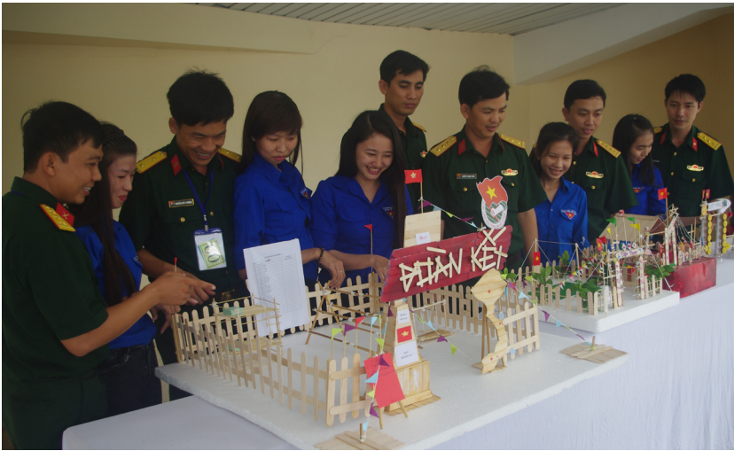
Những mô hình sân phẩm hoàn chỉnh sau bài học về lều trại.