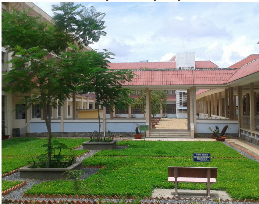
Công trình "Công viên mini" đạt giải Nhất của Khoa Sư phạm.

và đề xuất xem xét, đưa vào ứng dụng trong điều kiện thực tế của Nhà trường, để các hoạt động của các đơn vị ngày càng đạt hiệu quả cao, góp phần cho sự phát triển chung của Trường ĐHCT trong thời gian tới.